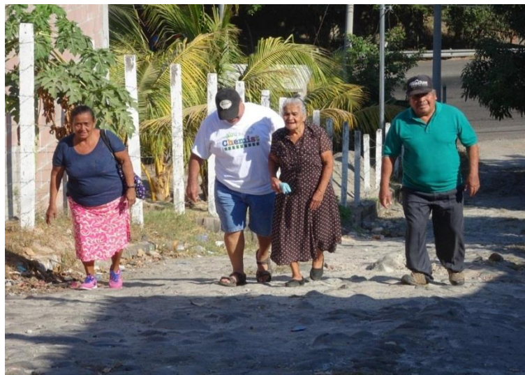
(Miembro de la familia ayudando a una anciana a subir la cuesta fuera del centro de votación)

Tamanique: En el Centro Educativo San Alfonso había canaletas entre los patios y las aulas. La barrera más grande era la cuesta muy empinada que conduce a las instalaciones. En muchos casos, las personas mayores, discapacitadas o con problemas de movilidad, las mujeres embarazadas y las que llevaban niños pequeños, tenían problemas para subir. Una vez dentro del centro, los vigilantes casi siempre les prestaban la ayuda necesaria.