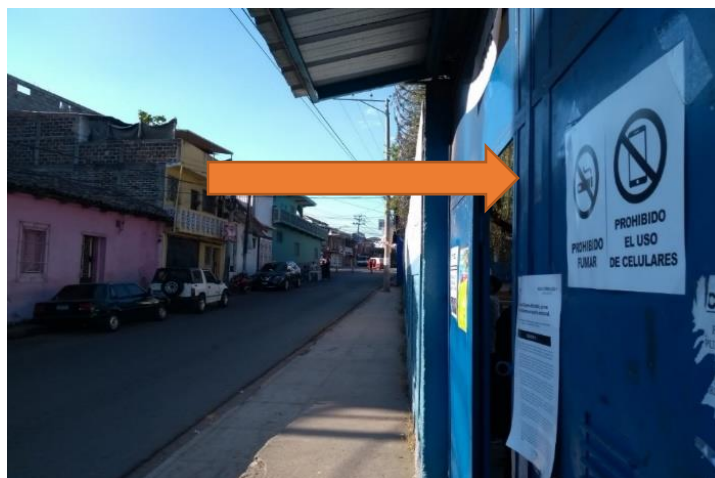
(Prohibido fumar / Prohibido el uso de celulares)

Este póster creó una confusión general entre las autoridades en cuanto a si estaba prohibido todo uso de teléfonos celulares dentro del centro de votación. Nuestros observadores documentaron situaciones en las que muchos votantes, miembros de las JRVs, vigilantes de partidos y otros usaban constantemente sus teléfonos celulares para acceder a la aplicación móvil del TSE diseñada para informar a los votantes de la ubicación de su JRV asignada. También hubo innumerables situaciones en las que las personas usaban sus teléfonos celulares para uso general. Algunos miembros de JEM y delegados de la FGR interpretaron el aviso del cartel de "no usar teléfonos celulares" y aplicaron una política absoluta de no usar teléfonos celulares dentro del centro de votación, y no solo durante el tiempo prohibido desde el momento en que un votante recibe su papeleta hasta el momento en que la deposita en la urna. Los siguientes son ejemplos del uso documentado de teléfonos celulares en varios centros de votación donde los observadores del CIS estaban desplegados: