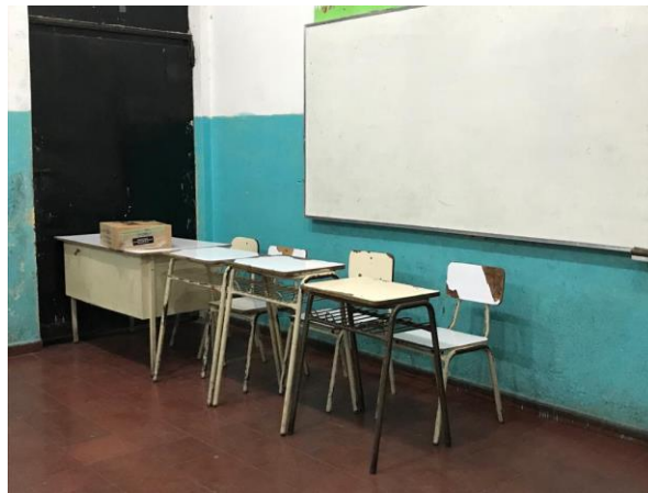
(Cojutepeque – El Paquete Electoral fue dejado en un salón vacío y sin que los miembros de la JRV hubieran firmado de recibido)

La integridad del paquete Electoral depende de la seguridad proporcionada tanto por la PNC, así como por la JEM durante el almacenaje y la entrega. En muchos casos, nuestros observadores documentaron que durante los procedimientos de apertura del centro de votación en Cojutepeque, específicamente en el Centro Escolar Anita Alvarado, los paquetes fueron entregados a las JRVs y fueron dejados desatendidos y sin que la JRV hubiera firmado de recibido (contrario al artículo 189 del Código Electoral). También documentaron que hubo JRVs en donde el acta de instalación fue completada hasta mucho más tarde en el día. Nuestros observadores en Ilobasco informaron de situaciones similares en el Instituto Nacional de Ilobasco. Además, en Cojutepeque, en el Centro Escolar Eulogia Rivas (JRV #7828), al paquete le faltó el "inventario de contenido".